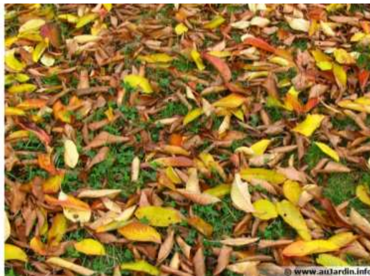
Les feuilles mortes recouvrent la pelouse à l'automne

Craquement sous les pieds, couleurs chaudes et odeur d'humidité, les feuilles mortes sont de retour, jonchant le sol de leur camaïeu chatoyant. Le jardinier est rarement tenté de laisser envahir pelouses, allées et massifs par cette pluie végétale mordorée qui pourtant est susceptible de rendre bien des services.